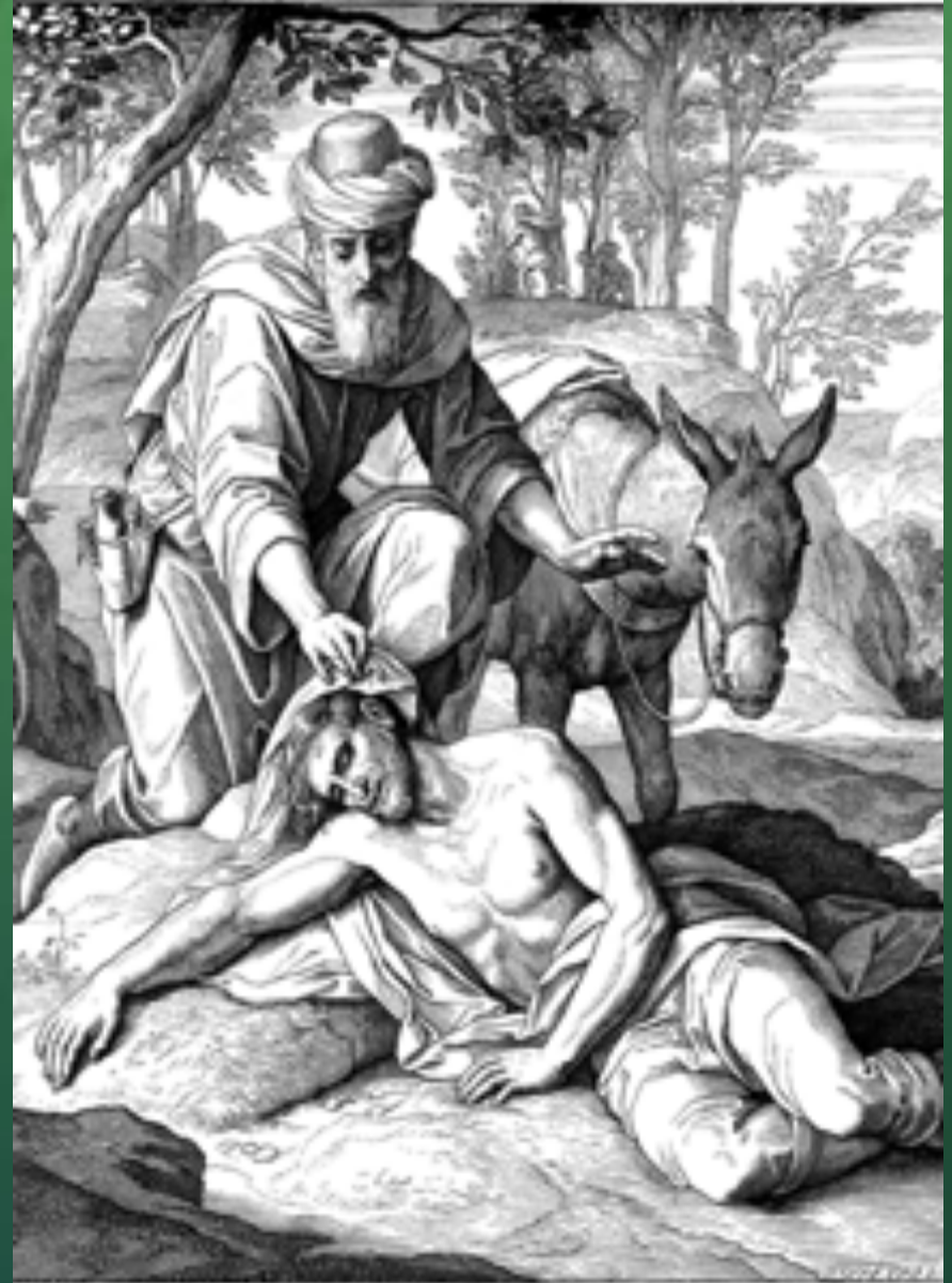
Gleichniß von berührten Samaritanen.

... mit dem heilig, und so er ihn sah, jammerte ihn sehr; ging zu ihm, und umarmte ihn mit Freuden, und sprach: und setz ihn auf dein Pferd, und schütze ihn in die Herberge, und pflege ihn, Mt. Luc. Kap. 10. v. 35. 36.